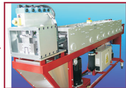
ScotTruss роликовая листогибочная машина для производства ферм