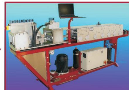
7-й выпуск роликовой листогибочной машины Rf90 и RF140